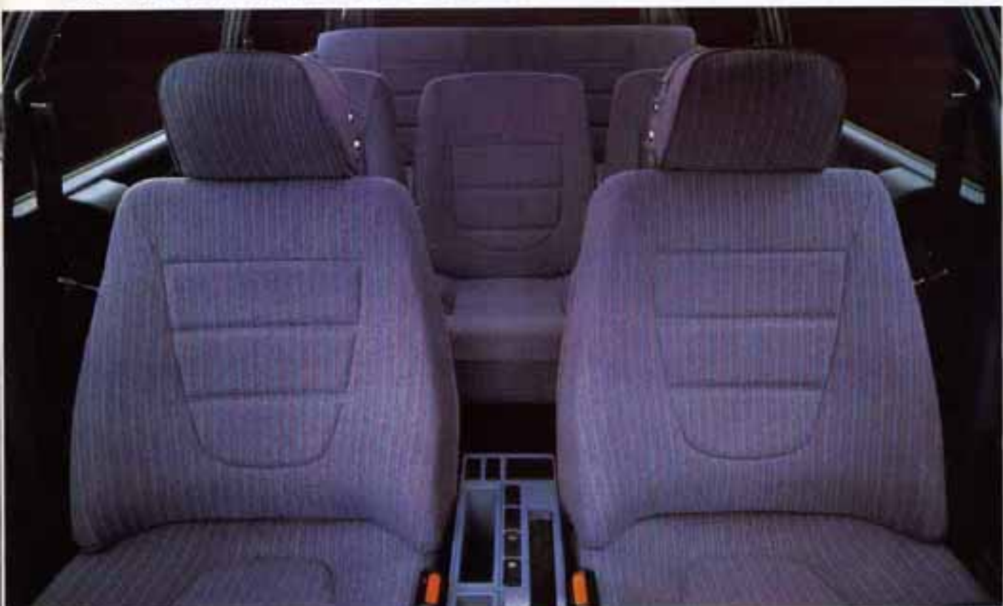
Intérieur de famille CX 25 RD. Intérieur de Break CX 25 RD avec lûcher et peinture métallisée verre en option.

employés : tissus "haut de gamme" ou cuir selon votre choix, moquette épaisse au sol, etc. Les sièges anatomiques offrent à la fois un très bon confort d'assise ainsi qu'un excellent maintien latéral. La CX : un nouvel art de vivre.