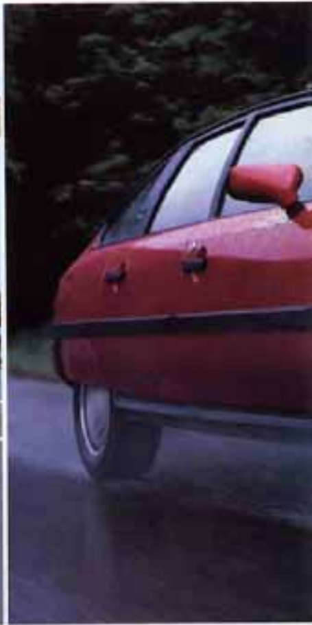
CX 25 RD Famille avec isolation thermique, glaces teintées et peinture métallisée verrie en option. Galerie de toit en Accessoire. CX 20 RE Break avec peinture métallisée verrie en option. Crochet de remorque en Accessoire.