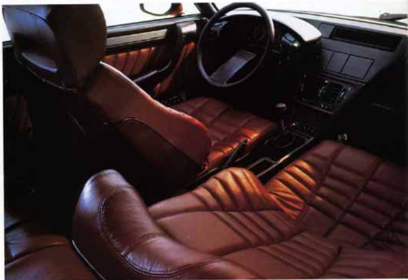
Intérieur de CX 25 GTI Turbo 2 avec garnissage cuir en option. Plancher de bord de CX 25 GTI Turbo 2 avec climatiseur en option.

La CX est un équilibre qui associe l'habitabilité au confort, le plaisir de conduire à la sécurité. Le style intérieur crée une ambiance moderne, faite de grand confort de par la qualité des formes et des matériaux