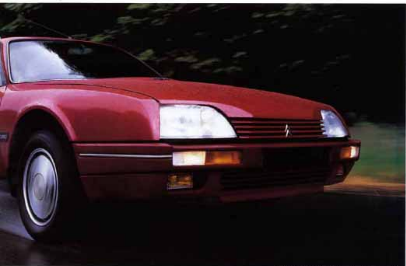
CX 25 GTI Turbo 2 avec peinture métallisée verre en option.

Héritière de la grande tradition automobile, elle est le symbole d'un art de vivre, celui d'une voiture hors du commun.