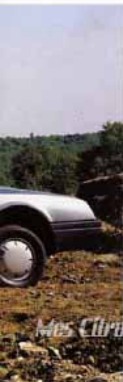
CX 20 RE avec peinture noire verre en option. Appui-tête AR et rétroviseur droit en Accessoire.